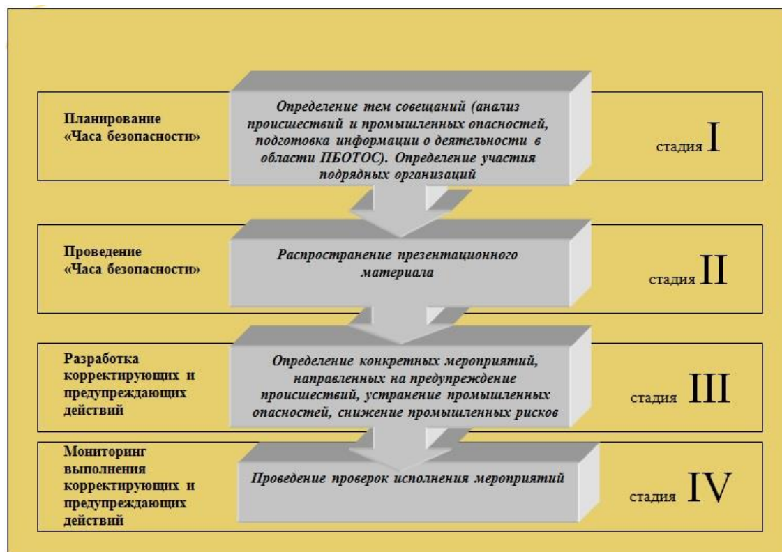
Рисунок 1. Схема планирования, проведения тематического совещания «Час безопасности»

Утверждаемые графики обязательно должны содержать темы, специфичные для условий работы и осуществляемой деятельности, ФИО и должность ответственного за подготовку презентационных материалов, ФИО докладчика.